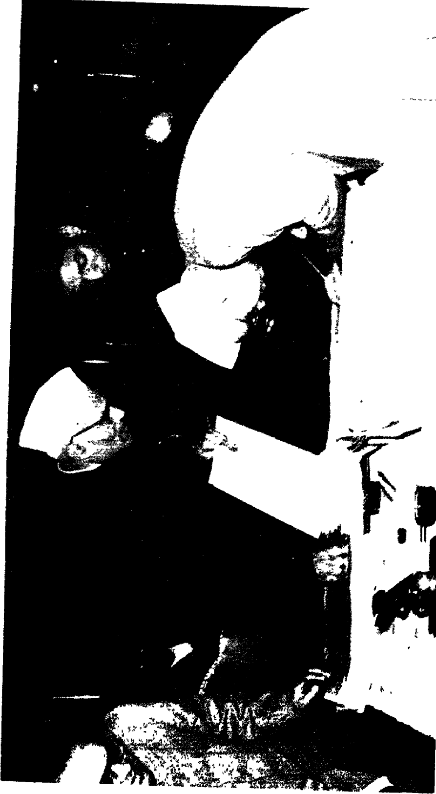
पंडित जवाहरलाल नेहरू संविधान पर हस्ताक्षर करते हैं। उनकी नाई गार है, कि एम प्रशी